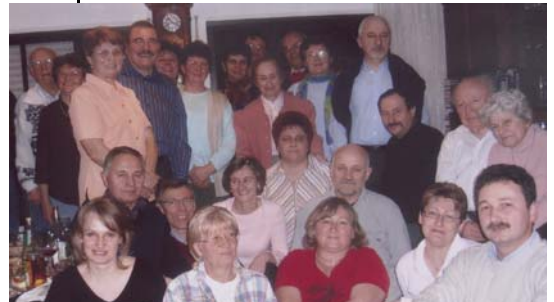
Bibliáóra Stuttgartban az ilencfalviakkal