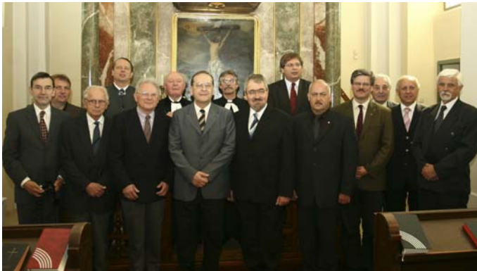
Az óriszigeti templom oltára előtt

kezdtünk. Ezt az alkalmat az óriszigeti női kar gazdagította éneklésével.