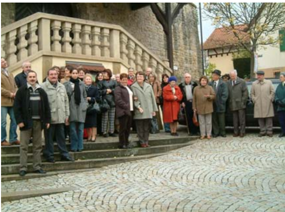
A konferencia résztvevői kiránduláson