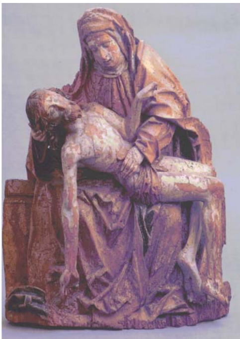
Pietà Keszthelyről, 1500 körül

Igazán látni akarjátok? Elhaló gabonamag ő. Majd visszaadja a napkeleti bölcsék és napnyugati görögök látogatását. Elmegy majd a népekhez. De hogy igazán elmehessen, először a halálba kell mennie. Ha nem ezt tenné, „egymaga maradna”. De ezt teszi, s ezért majd időszerte és világszerte sok gyümölcsöt terem. Itt van az Isten irgalom-tervének megmászhatatlan szabálya: Halálból fakadjon élet! Krisztus halálából millió milliók élete. Mi nem Jézus Krisztus szép tanításából és szép példájából élünk, hanem bűnbocsánatot szerző halálából.