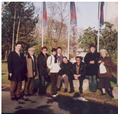
A testvérgyülekezet küldöttsége

A négynapos látogatásunk záró akkordja a vasárnapi istentisztelet volt, ahol kisebb-nagyobb fizikai távolságokból érkezve voltunk együtt a 84. zsolnárból vett Ige körül, lehattunk tanúi a presbiterek fogadalomtételének. Fel-emelő érzés volt megtapasztalni az együvértartozás erejét, mint ugyanazon nemzetnek fiai.