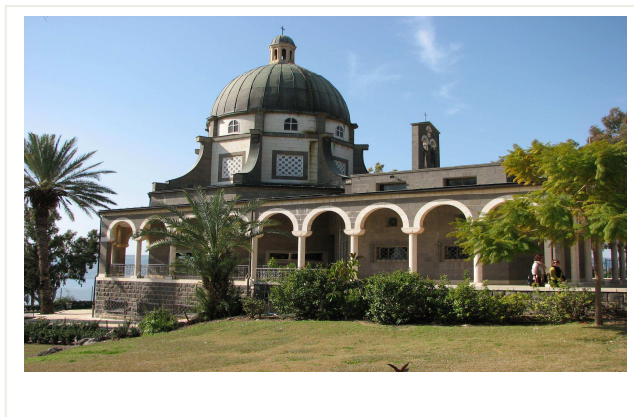
A Boldogmondások temploma

Várjuk jelentkezését és élményekben gazdag, szép utazást kívánunk!